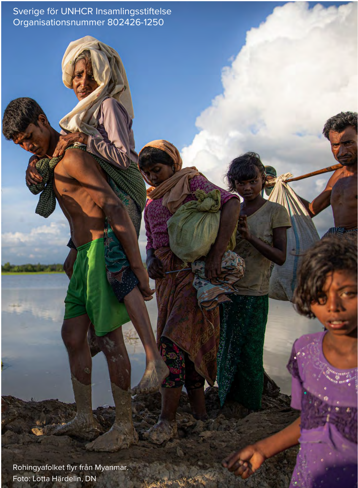
Rohingyafolket flyr från Myanmar.

Sverige för UNHCR Insamlingsstiftelse Organisationsnummer 802426-1250