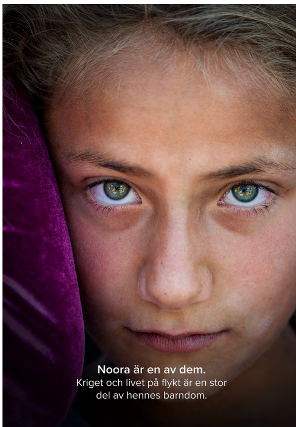
Kampanjen Human Facts, 2019