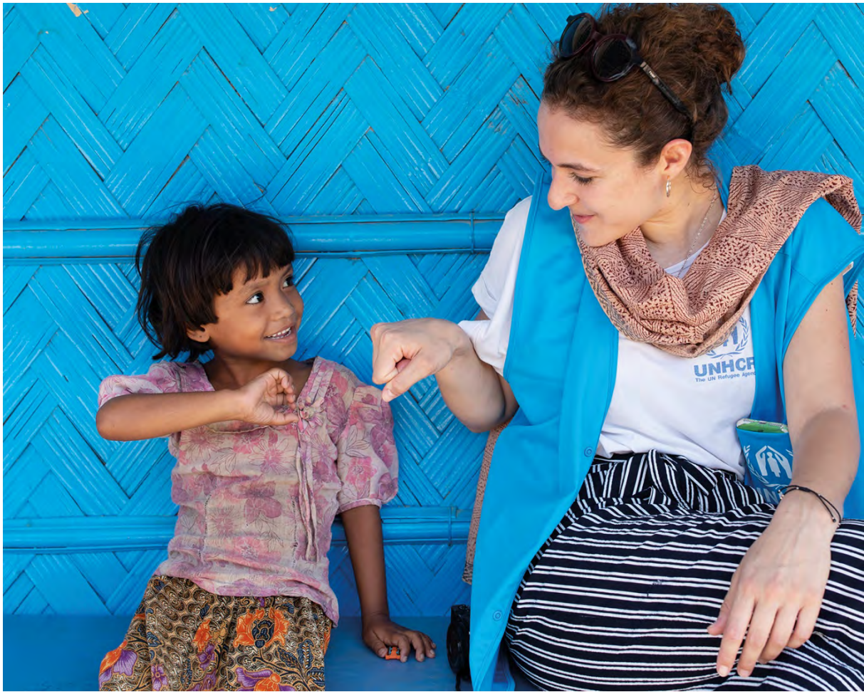
En liten flicka får hjälp av UNHCR på en hälsoklinik i ett flyktingläger i Bangladesh.