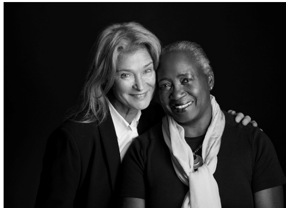
Vår nya ambassadör Lena Endre (th) och Barbara Hendricks (tv), hedersordförande i vår styrelse.

– Att få vara ambassadör för Sverige för UNHCR är för mig både väldigt ärofyllt och väldigt viktigt. Jag fick själv se deras arbete in action när jag tillsammans med dem besökte flyktinglägret Azraq i våras. Deras arbete är livsviktigt och jag är stolt över att få förmedla deras budskap till mina följare, säger Clara Henry.